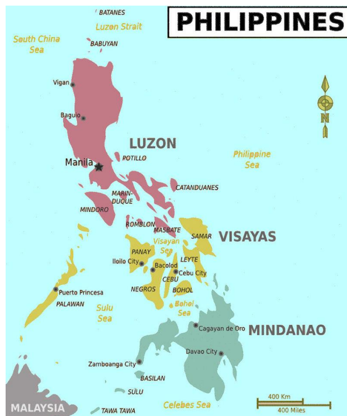
รูป แผนที่ ประเทศฟิลิปปินส์ 7

ทั้งนี้ จากการพิจารณาโครงสร้างเศรษฐกิจของฟิลิปปินส์ปี ค.ศ.2011 พบว่า ภาคเกษตรกรรมซึ่งเคยสร้างรายได้หลักให้แก่ประเทศในอดีต ปัจจุบันมีสัดส่วนเพียงประมาณร้อยละ 12.8 ของผลิตภัณฑ์มวลรวมภายในประเทศ (Gross Domestic Product – GDP) เท่านั้นที่เป็นเช่นนี้สืบเนื่องมาจากการเพาะปลูกยังคงพึ่งพาสภาพธรรมชาติเป็นหลัก และการขาดระบบชลประทานที่ดี รวมถึงพื้นที่การทำเกษตรกรรมได้ลดน้อยลง ซึ่งปัจจุบันเหลือเพียงร้อยละ 20 ของพื้นที่ทั้งประเทศ 6 ขณะที่ภาคอุตสาหกรรมคิดเป็นสัดส่วนประมาณร้อยละ 31.5 ของผลิตภัณฑ์มวลรวมภายในประเทศ อุตสาหกรรมสำคัญได้แก่การผลิตชิ้นส่วนอิเล็กทรอนิกส์ สิ่งทอและเครื่องนุ่งห่ม รองเท้า และอาหารแปรรูป ซึ่งเขตอุตสาหกรรมส่วนใหญ่อยู่ในเขตกรุงมะนิลาและปริมณฑล สำหรับภาคบริการมีสัดส่วนในผลิตภัณฑ์มวลรวมภายในประเทศสูงที่สุด หรือคิดเป็นร้อยละ 55.7 ส่วนใหญ่เป็นการค้าปลีกและค้าส่ง บริการด้านอสังหาริมทรัพย์ การขนส่ง ท่องเที่ยว และโรงแรมรวมทั้งรายได้จากแรงงานฟิลิปปินส์ที่เดินทางไปทำงานยังต่างประเทศ